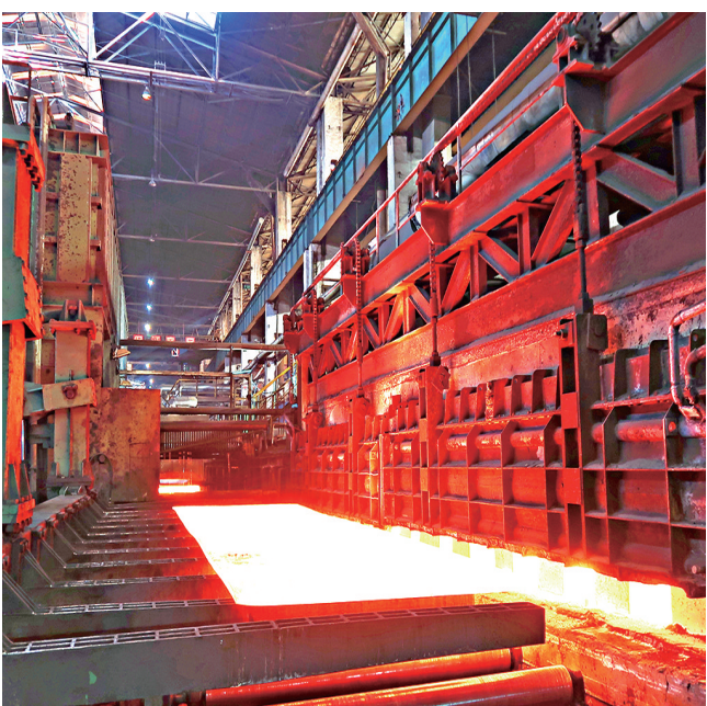
太钢不锈钢热轧厂以提高产品实物表面质量为重点,从钢坯加热、钢板轧制、热处理等各工序加强标准化操作,严格执行工艺规程,钢板质量稳步提升。图为外机炉生产画面。