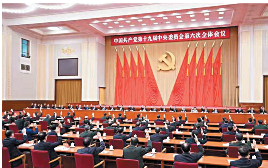
中国共产党第十九届中央委员会第六次全体会议,于2021年11月8日至11日在北京举行。中央政治局主持会议。