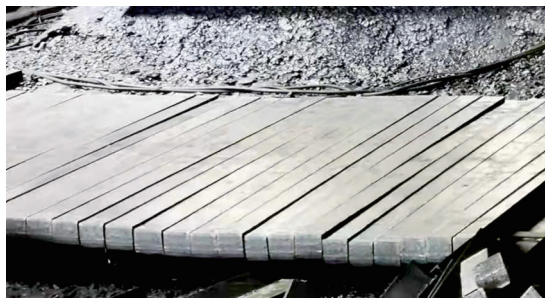
太钢生产的高品质纯铁产品受到市场青睐。