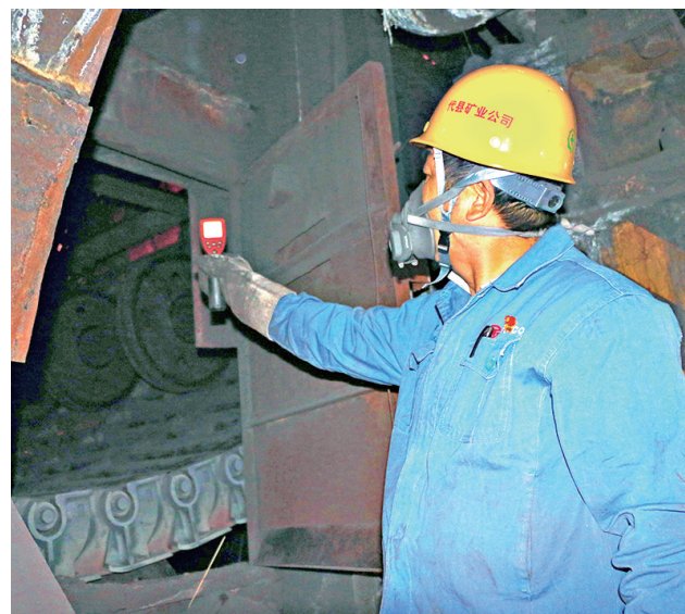
太钢代县矿业公司把深入学习宣传贯彻党的十九届六中全会精神与“我的岗位我经营”“我为企业献一计”结合起来,坚定职工立足岗位作贡献的责任感和使命感,为迎接党的二十大召开、开启奋进新征程奠定坚实基础。图为焙烧作业区职工正在收集链篦机温度数据,为球团矿生产组织提供精准依据。

吹响安全生产的“集结号”。把安全宣教工作挺在前,结合近期安全生产事故,深刻剖析事故背后的原因,用血的教训警示员工,远离违章,遵章操作,不分时间、地点宣传《新安全法》及法规,及时传达公司安全部署及会议精神,充分发挥宣传思想的引导优势,把安全生产知识宣贯到岗位人头,牢牢守住安全生产的红线,筑牢发展的底线,在潜移默化中增强全员安全意识,提升安全技能,激发全员安全生产的积极性、主动性、自觉性,使“我能安全”落地生根,确保安全生产。