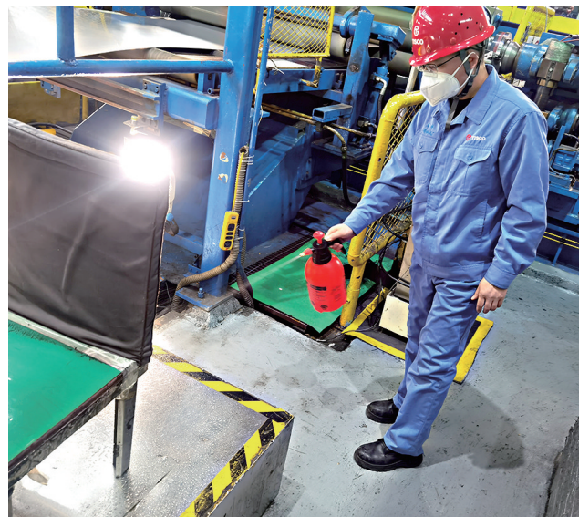
日前,太钢不锈冷轧厂党委启动疫情应急预案,及时安排部署防疫工作。在被封控管理300余人,近20%天车操作人员、36%包装工序人员不能到岗的不利条件下,采取四班三运转调整为三班两运转、管理人员下一线协助操作等措施,克服不利因素,保障生产顺利进行。充分发挥党支部战斗堡垒、党员先锋模范作用,成立50余支党员突击队、青年突击队开展消杀工作、食堂分流引导等工作。

对标+创新,激发内生动力。紧跟行业技术前沿,建立推进创新体制机制,鼓励全员创新,每半年组织一次管理现代化创新成果和科技创新成果评比,营造浓厚创新文化氛围,厚植创新发展优势;积极申报高新技术企业、企业技术中心、创新工作室,持续提升企业技术实力;开展科技攻关课题承包,组织上盘排土场排土优化研究、新型废石筑坝工艺优化研究、降低钢球单耗技术研究、低温捕收剂试验等科技攻关项目,切实解决生产技术“卡脖子”难题;加快智慧化矿山建设进程,推进胶带机器人智能巡检、物流中心普明站铁路货检智能监测、浮选专家系统、球团智能造球和排土机、皮带机智能化升级改造等重点工作。