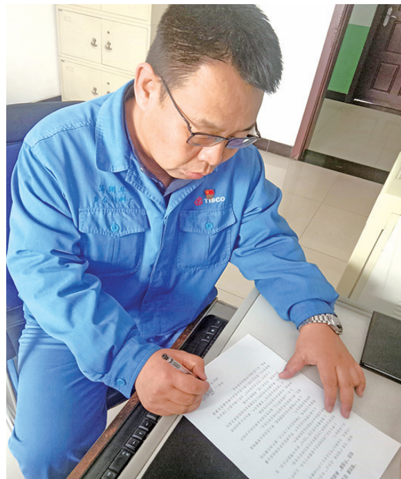
太钢复合材料厂焙烧作业区党支部在“强党建,促安全”专项活动中,组织全体党员进行了“党员无违章”承诺签名活动,让党员在安全生产中亮身份、践承诺、做表率,带头履职尽责,确保安全生产。

守住安全生产红线,确保隐患无处遁形。坚持公司、分厂、班组三级安全大检查,对生产现场、检修项目安全隐患进行拉网式大排查。以“全员动员、人人参与、从身边查起、从岗位查起、从接班查起、从作业流程查起”为隐患排查要求,各层级管理干部分片挂靠参与班组排查活动,重点对所辖范围内的劳动防护、作业环境及人员行为进行全程监督,切实落实安全管理责任。强调落实好检修现场交底,重点对检修施工地点、周围危险因素及安全防范措施、检修地点周围重要设施等进行详细交底,确保将隐患消灭在萌芽状态,全力消除“想不到、管不到”的问题。