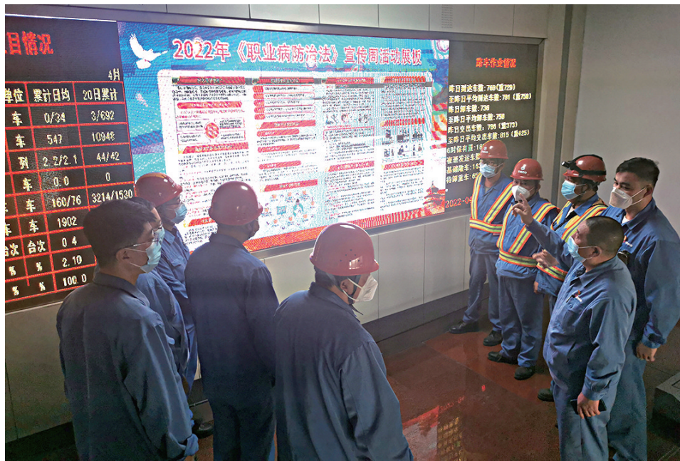
在全国第20个《职业病防治法》宣传周之际,太钢物流中心利用LED大屏等载体,向广大职工和协作供应商人员宣传职业病防范知识,强化职工的自我防护意识,切实保障职工职业健康权益。

该厂纪委将围绕违规发放津补贴、违规操办婚丧喜庆事宜等方面,采取明察暗访、个别谈话、随机抽查、接受举报等方式,开展节日期间“四风”整治工作,把纪律和规矩挺在前面,立足抓早抓小,强化监督执纪问责。