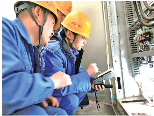
为深入推进智能化矿山建设,太钢代县矿业公司积极组织技术人员开展“泵站溢流水提升泵液位自动连锁改造”工作,切实降低现场岗位人员的劳动强度,实现水系统设备精准控制。图为工作现场。

抓手,努力消除各类安全作业风险;深挖安全工作潜力,充分利用好“强党建、促安全”专项行动,将党组织战斗堡垒作用和党员模范带头作用发挥引入现场安全管理,以实际行动为安全生产赢得主动赢得优势,夯实安全工作基础;强化安全活动方式方法创新,以紧贴实际、组织高效为目标推进周安全活动效果再提升。大力开展以“安全为了谁?”为主题的安全思想教育,通过视频回放和行为跟踪检查机制,认真梳理地下开采作业流程环节,强调洞内环境因素识别,落实个人防护和安全互保,持续完善和改进作业标准,增强职工安全标准化作业素养养成,推进严肃违章查处机制,确保安全生产无事故。