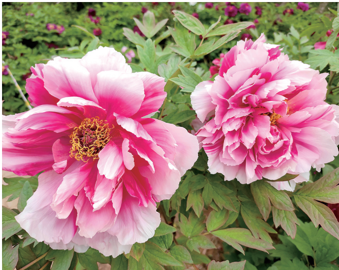
唯有牡丹真国色