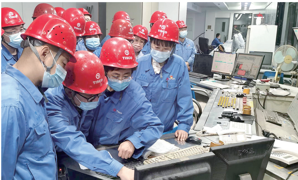
近日,太钢教培中心开展质量培训下现场、教学演练长技能活动,以教促思,以教促研,以练促学,以练促行,真正做到了学以致用,学有所获。图为太钢热连轧厂精轧区 SPC 自动监控系统操作教学现场。

一是明确整治范围和要求,从“参观沿线”向外延伸,对管廊管道、设备设施和构筑物外墙及顶部等高标准亮化粉刷,对内墙、地面、设备等全面清扫清洁,恢复设备本来面貌。二是扎实推进“设备见本色”工作,每天召开例会通报前一天各作业区设备见本色工作计划完成情况以及存在的问题,对现场亮点、灰点进行点评,让大家学习有方向,完成有标准。安排当日设备见本色重点工作,严格按计划推进。充分发挥好现场监护人作用,做到安全和质量实时受控,确