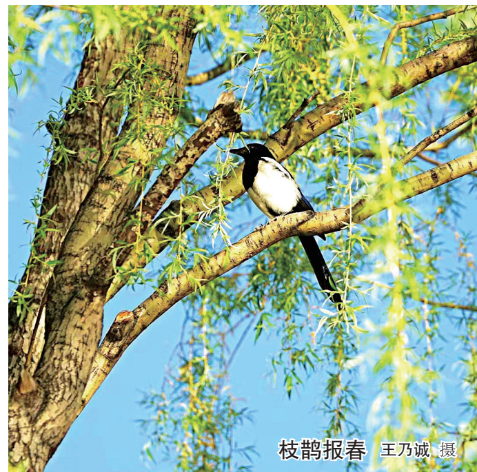
枝鹊报春

童年的小人书情结,使我养成了良好的读书习惯,特别是到太钢参加工作后,读的书虽然渐渐多了,但我始终放不下对童年小人书的情结。诚然,不排除有“雾里看花”的成分,但不能否认小人书对一个人成长产生的潜移默化影响,至少积淀了人生宝贵的经历。