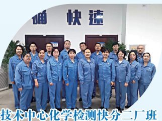
技术中心化学检测快分二厂班

太钢技术中心化学检测快分二厂班荣获“全国工人先锋号”。他们以创建“工人先锋号”为平台，夯实班组管理基础，无私地默默服务于技术创新，在化学检测中谱写了“工人先锋号”的时代新歌。