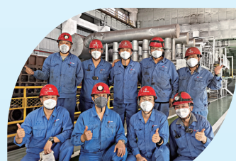
炼铁厂四烧作业区烧结生产班

小班组蕴藏大能量。团队，彰显了当代钢铁工人面对艰巨的生产任务，太人的担当和创新精神。