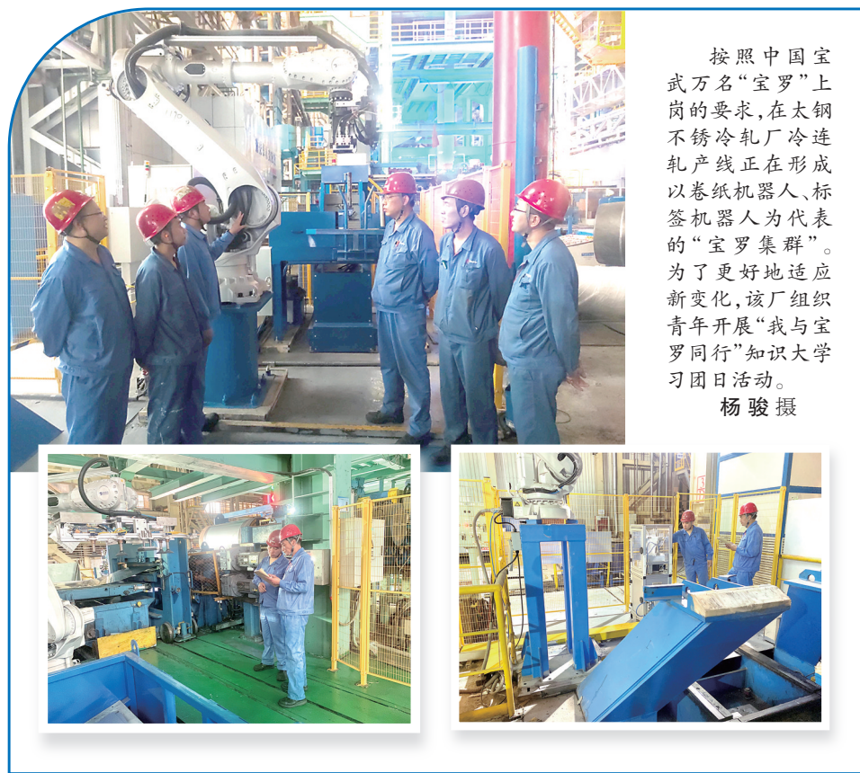
按照中国宝武万名“宝罗”上岗的要求,在太钢不锈钢冷轧厂冷连轧产线正在形成以卷纸机器人、标签机器人为代表的“宝罗集群”。为了更好地适应新变化,该厂组织青年开展“我与宝罗同行”知识大学习团日活动。

“生命是一去不复返的”,安全工作永远不能松手,否则遗憾终生。唯有保证安全,才能拥有生命,在此,我呼吁“珍爱生命,我要安全”,让生命之花绽放在你我心中。