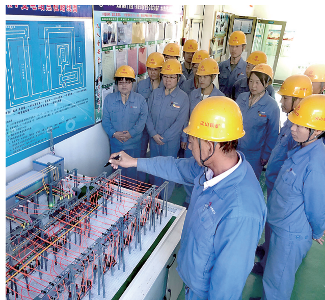
为提高电工应急处置能力,太钢尖山铁矿成品动力部水电作业区利用110kV变电站实景沙盘,组织主控班电工开展应急处置模拟演练活动。图为职工利用实景沙盘模拟讲解事故发生应急处置措施。 孟亮敏 摄 郑惠文

道口安全关乎我们每个家庭的幸福,守护道口安全是你我共同的责任。只有我们人人都加强安全意识,积极主动地消除安全隐患,那么我们铁路的安全才能得到真正的保障。