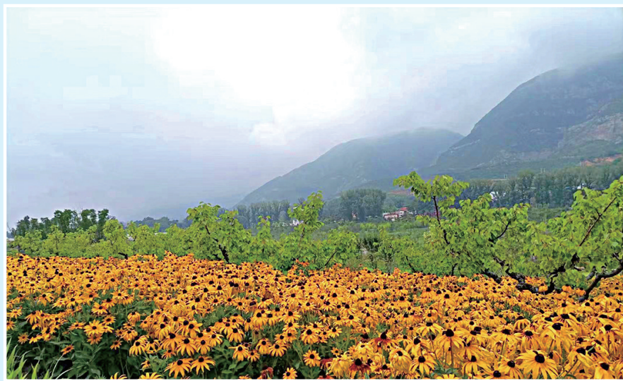
风景这边独好

闲来读书，看到一个词“癥瘕”。它是中医特有的病症名称，是基于中医理论对人体病理变化的一种诊断。说到诊断，现在基本是西医诊断的一个大环境，大家基本上习惯用西医的诊断结果去沟通。比如，鼻炎，腺样体肥大，或者幽门螺杆菌，子宫肌瘤等，这些都是西医病名。有意思的是，很多西医诊断不一样的病名，比如慢阻肺和哮喘，到了中医这里，很可能得到的结果一样，开方也一样。甚至有时候似乎从症状上看起来八竿子打不着的患者在中医这里得到的诊断结果也是一样的。一位朋友是中医大夫，给我讲述过她出门诊时遇到的一个案例。5岁的患者因为频繁眨眼挤眉弄眼来看诊，查了很多家医院诊断都是干眼症，因为遗传导致的无法根治，最后的治疗是终生去滴眼药水。孩子父母不能接受这个诊断，开始探寻中医帮助。中医讲究四诊合参望闻问切，大夫问了一圈看了一圈排除了一些问题，开始切诊了，发现孩子第一很虚，正气不足的状态，第二是腹部有明显凉痰