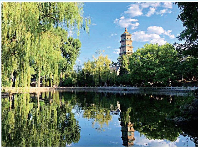
晋祠一角

我常自责，为什么要粗暴地打断母亲幸福的时刻，我为什么就不能耐心地倾听母亲讲过去的故事？她还有多少这样的幸福时刻？