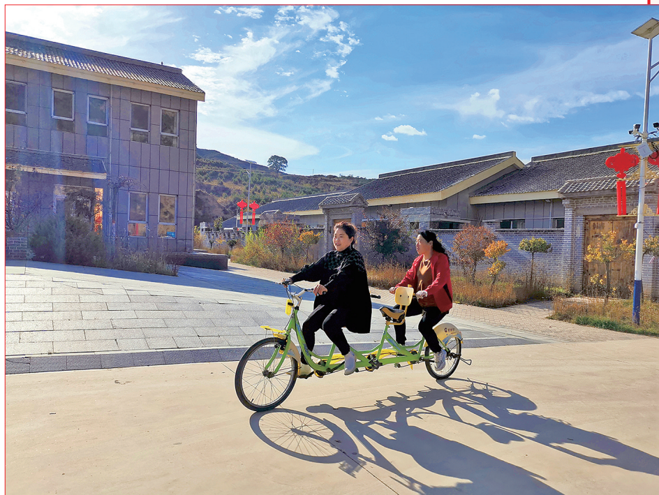
图8、图9:旅游区一景。图/文 王旭宏 李俊杰 张军 孙敬