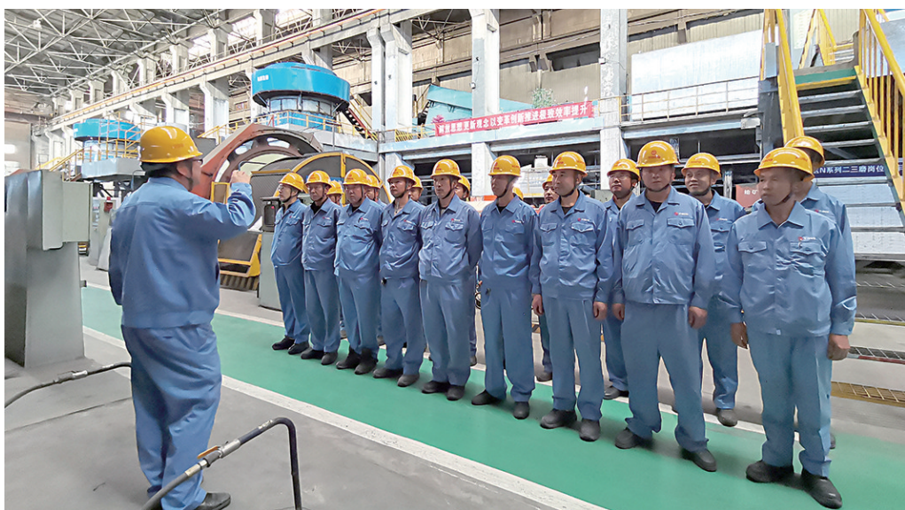
太钢尖山铁矿不断强化安全生产过程控制,实施作业项目分级管理,紧盯安全措施和作业行为,加强管理消除现场安全风险。图为该矿磨选作业区生产班对当班高风险作业项目进行安全确认。

六是提高安全意识,严守安全底线。始终发挥好党总支“把方向、管大局、促落实”作用。以党员零违章为抓手,发挥好党员责任区作用,持续开展“强党建、促安全”专项行动,改变工作作风,各级干部、管理人员要开展穿透式管理,深入基层班组、深入作业检修现场,花大力气找问题和找准问题,实地了解现场情况,带头参加基层班组的班前班后会、周三活动,迈开步子,沉下身子、放下架子,多与一线员工交流,将安全管理技术、理念传递到一线员工,不断夯实班组安全工作基础。树立“一切事故都可以预防”的理念,严格落实安全生产责任制,强化排土场、采矿区域以及煤制备等重点领域的专项整治和隐患排查整改,坚决消除监管盲区。