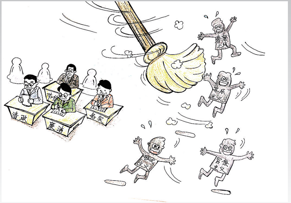
扫除不正之风 张宏敏作

假如一觉醒来，疫情消失了，新闻联播循环播放这一振奋人心的好消息，微博热搜榜上霸满这令人喜悦的头条，各种微信群里争先恐后地转发着这一条推文……行程码、健康码彻底取消，口罩从脸上卸下，核酸检测点逐个拆除，各地恢复人来人往，车水马龙。我们都迫不及待地走出家门，后知后觉地丢掉了顺手拿起的口罩。看着大街上人们那灿烂的笑容不再被口罩遮盖，此刻的我们，只想拥抱身边每一个有着同样喜悦的人。