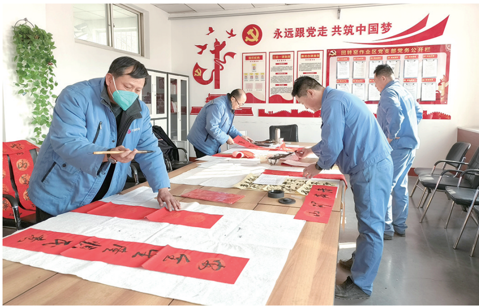
为进一步强化春节期间的安全生产工作,营造安全祥和的节日氛围,近日,太钢东山矿组织开展了安全春联征集活动,通过征集、评选、书写等形式,提升职工的安全生产意识,引导职工绷紧安全弦,用实际行动助力企业的安全生产形势稳定好转。图为职工书写征集的春联。 高爱忠 文

潜在的各类风险隐患,有针对性地制定采取防范措施,重点对危险化学品、危废处置、工业气体、消防安全、道路运输、设备设施、特种设备及工业建筑等方面开展全方位的安全隐患排查大整治,做到全覆盖、无死角、无盲区;领导干部制定日安全检查计划清单,每日开展地毯式、拉网式、滚动式检查,发现事故隐患、管理缺陷等问题立行立改、边查边改,一时不能整改的按照“六定”要求快速落实措施。每周对问题整改情况“回头看”,及时验证销号,为安全生产创造安全保障。