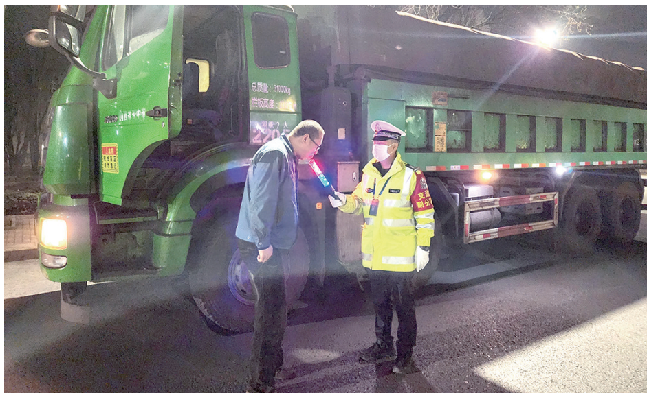
太钢保卫部大力开展“一总部多基地”春季交通安全综合整治,组织人员在厂区各主要路段、路口进行夜查。重点针对酒后驾驶、不按规定使用灯光、安全设施不全等交通违法行为及不文明行为进行查处,保持厂区道路交通秩序严查严管态势。

通过开展亲情与安全携手保安全活动,凸显了女职工协管抓安全、促安全的独特优势,更好地实现了亲情安全文化与班组安全文化的有机融合,为作业区的安全建设注入了新的活力。