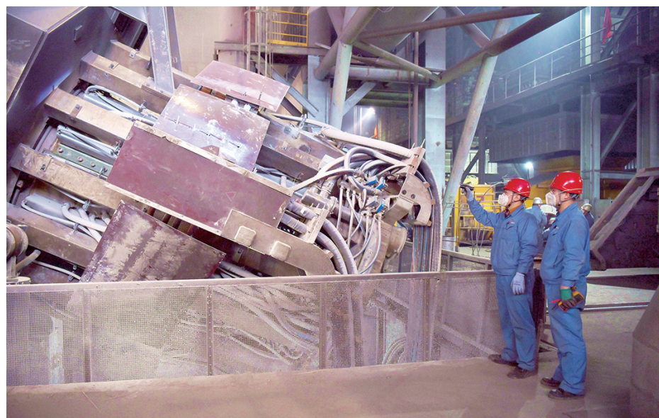
太钢炼钢二厂深入开展TPM(全员生产维护)活动,不断保持设备的最佳运行状态,为生产的顺利运行奠定了坚实的设备基础。图为点检人员对中频炉设备进行日常巡查维护。

本报讯(记者 孙敬)4月27日,太钢党委2023年第一轮巡察工作动员会暨巡察业务培训班开班。会议的主要任务是:深入学习贯彻习近平新时代中国特色社会主义思想、党的二十大精神和习近平总书记关于巡视巡察工作重要论述,全面贯彻落实中国宝武和公司党委关于巡视巡察工作的部署要求,准确把握被巡察单位职能职责,聚焦贯彻落实中国宝武和公司重大决策部署,聚焦群众身边腐败问题和不正之风以及群众反映强烈的问题,聚焦基层党组织和干部队伍建设,紧盯科技创新、安全环保、对标找差、“三降两增”、工程建设等重点工作,强化政治巡察,推动问题整改,为实现公司高质量发展保驾护航。