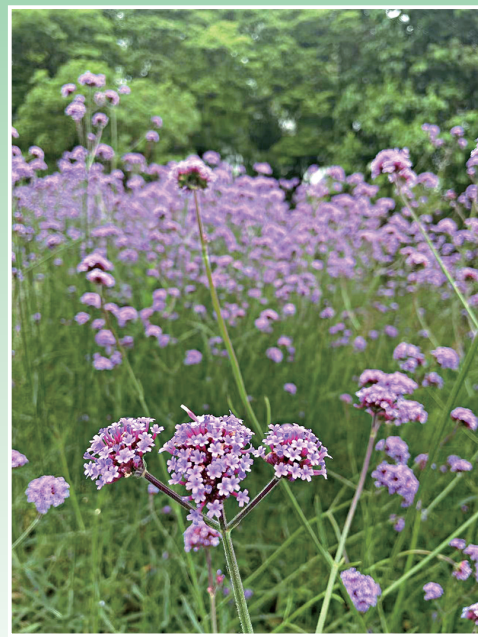
一花一世界