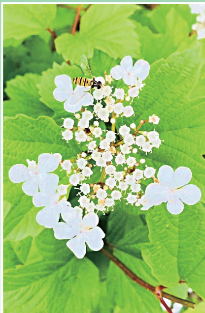
飞入花蕊中

给自己的青春插上一双飞天的翅膀,让我们的梦想和奋斗随着歌声不断前进,“我要飞得更高,飞得更高……”