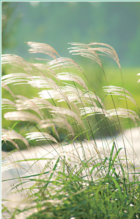
风吹麦浪

工作的终极目标是为了快乐与幸福的获得,要从工作中找到自信,充分发挥自身的潜能。工作着,快乐着,从工作中寻找快乐!这样,我们的工作,将更加高效;我们的生活,将更加精彩。