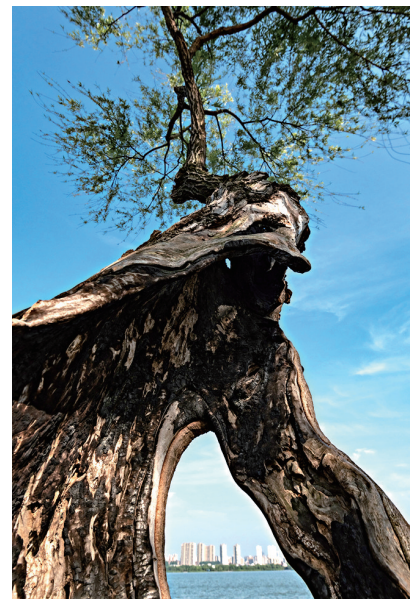
别有洞天

“以笑的方式哭,在死亡的伴随下活着。”因这样一句话,我认识了余华,邂逅了《活着》。余华是一位颠覆大师,被誉为中国的巴尔扎克、狄更斯。