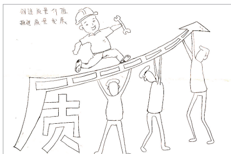
创造质量价值 推进质量发展 景婧 作