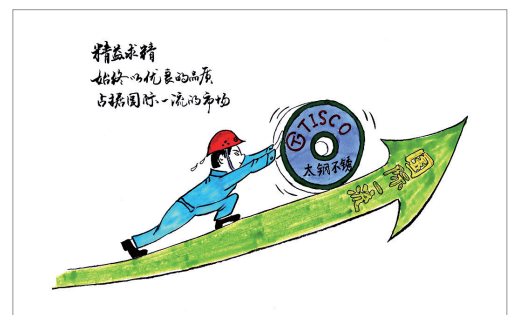
品质 兰建明 作