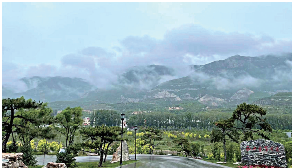
汾河烟雨朦

追求质量发展永无止境,建设质量太钢任重道远。作为一名太钢职工,我们要全力做好自己的本职工作,保证自己能够安全保产,争取零事故、零隐患、零失误,为太钢的高质量发展贡献力量。