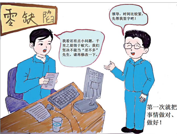
第一次就把事情做对做好 王思思 作