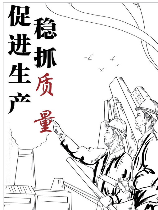
促进生产 稳抓质量 李凤英 作