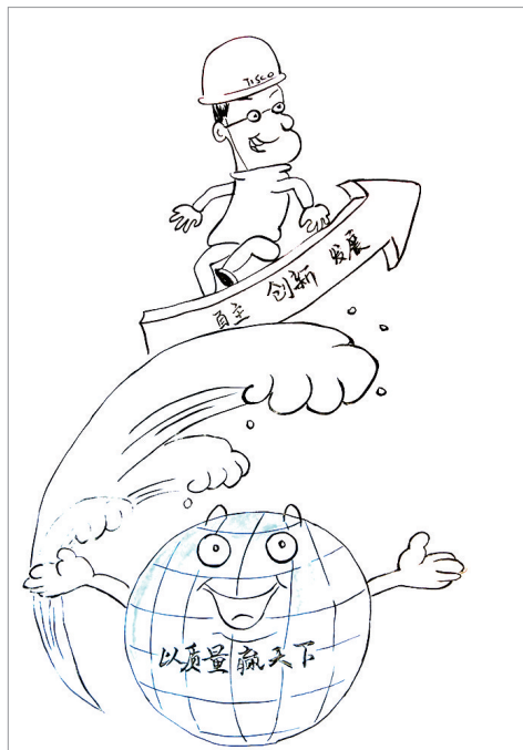
质量腾飞 李旺 作