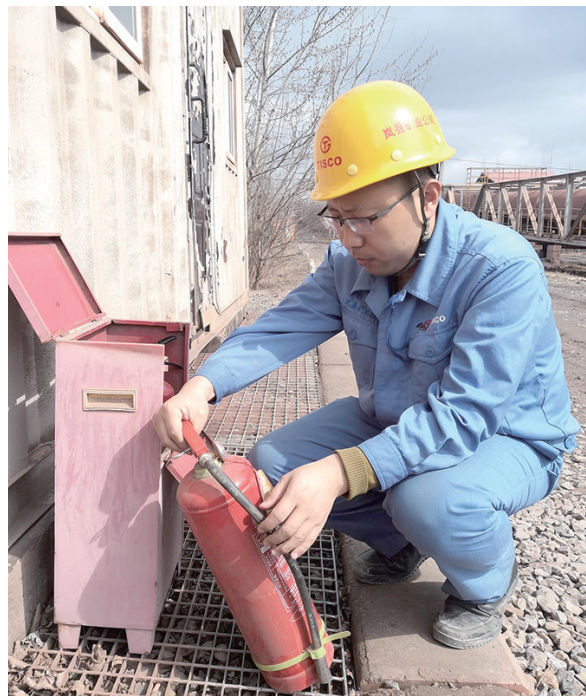
“消防宣传月”期间,太钢岚县矿业公司破碎作业区通过开展消防安全检查、消防隐患曝光、消防问题整改、经验推广、火灾案例警示、消防知识普及等活动,为该作业区创造良好的消防安全生产环境。图为消防安全检查现场。

“小心驶得万年船”,安全检修来不得半点疏忽和侥幸。我们每名检修作业人员都要努力学习技术,积累宝贵经验做“艺高”的人,但纵然我们“身怀绝技”,也绝不能“胆大妄为”,必须老老实实按标作业、遵章守纪,只有在安全上赢得满分,才能获得永久的“掌声”。