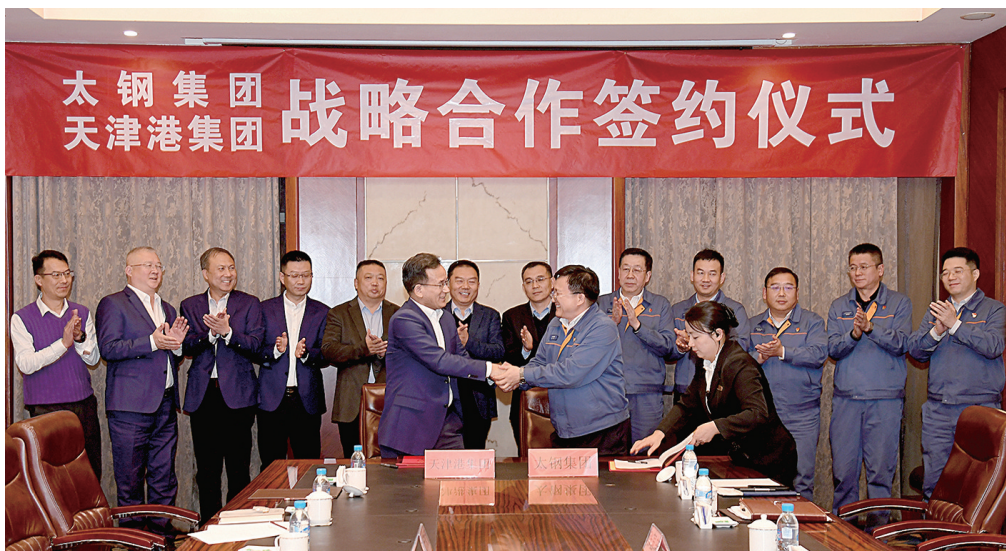
12月4日,太钢集团与天津港集团签订战略合作协议。