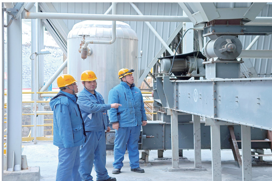
太钢代县矿业公司针对季节变化,加强对设备设施的检查力度,对设备设施缺陷进行改造完善。图为破碎作业区人员对现场设备进行检查。

加强宣传,营造氛围。结合近期国内发生的一些火灾事故案例,下发消防安全标语、口诀以及火灾事故案例,组织各单位结合本单位消防安全实际,对干部职工开展消防安全警示教育,培养单位消防安全“明白人”,切实提高消防安全责任人的消防安全主体意识和消防安全岗位人员的消防安全能力及引导职工疏散逃生自救能力;利用LED屏等媒介发送消防安全知识,有效提高干部职工的参与度,营造浓厚的消防安全宣传氛围。