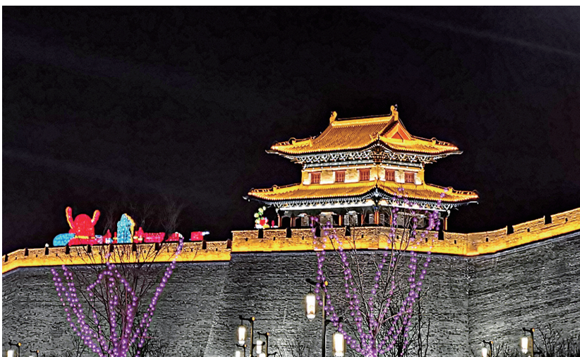
灯光波影 夜幕古城