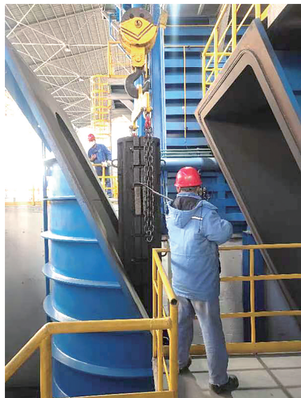
一季度,太钢型材事业部以生产精品、提升一次通过率为目标,按照钢种特点科学排产,统筹质量、成本、效益,生产经营实现高效顺行。图为职工正在精工作业。

如何才能让岗位规程中的标准更加贴合生产实际、更加准确完善呢?这就需要编撰人员在修订规程的过程中要结合新工艺、新设备和新材料运用的实际,开展走访、实际调研,对收集来的资料进行认真分析筛选,从一些好的操作方法或合理化建议中提炼出新的作业步骤,在总结分析的基础上,将新内容补充进去,并将不适宜的旧内容删除,经过专业技术人员反复论证和推敲后形成系统性的岗位规程。同时,还要做到语言精炼、表述准确,让人易于理解和记忆,这样才能为岗位人员标准化操作提供有力依据。总之,我们在岗位规程编制上必须有严谨科学的态度,审慎而为之,切不可应付了事。