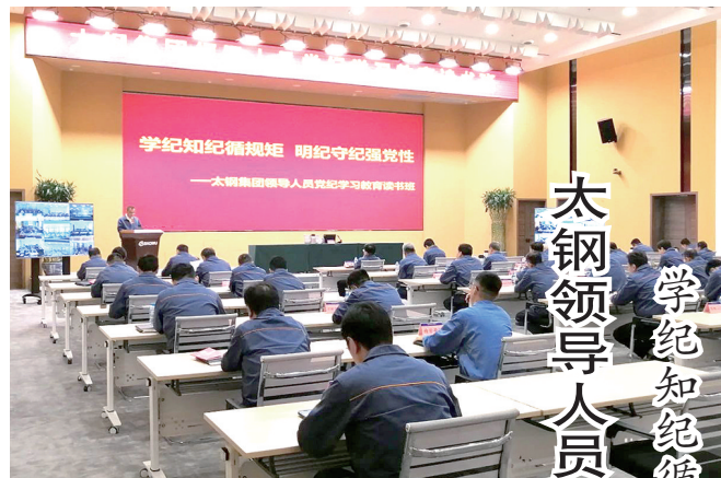
5月11日,太钢领导人员党纪学习教育读书班开班。

太钢清醒认识到,以“质高量减”为显著特征的行业深度调整需要一个较长的周期,钢铁市场供需弱化的局面将长期存在,微利乃至阶段性亏损将成为新常态。虽然当前行业出现了