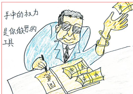
赵 樊 作