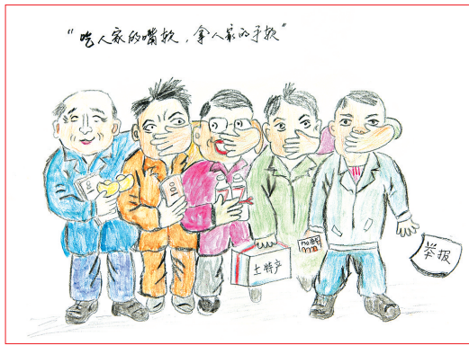
高 飞 作