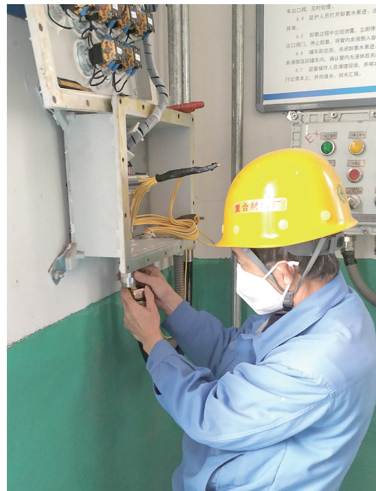
太钢复合材料厂焙烧作业区氨水站原有电机、料位计、压力变送器等设备电源线均采用普通软管进行保护,存在安全隐患,近日将所有普通软管进行更换,消除了火灾爆炸隐患。图为复合智维中心电工在进行线管更换。

公司各单位党委副书记、工会主席,党群部长、宣传干事、工会干事,公司工会宣教文体部全体人员,公司党委宣传部、公司党委组织部相关人员在现场参会。本次劳模先进事迹报告会,将陆续开展“弘扬劳模精神凝聚奋进力量”太钢庆祝建厂90周年劳模工匠走基层、进班组宣讲活动,让一线职工近距离感受劳模精神,学习劳模,以劳模为标杆,凝聚起更加奋进的磅礴力量。