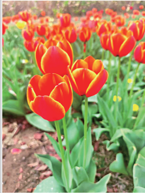
红映春意

当我们想起苏轼，嘴角总会露出微笑，你会觉得，生活美好，人生可期。他就像一股清流，洗净内心繁杂、彷徨、迷茫。而这份豁达和修养、淡然和清醒便是苏轼留给我们最重要的精神食粮。