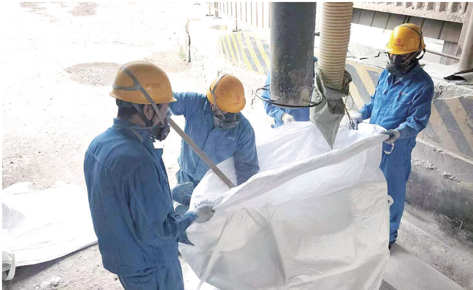
近年来,太钢东山矿强化创新引领,积极打造产研融合的创新体系,将创新工作室划归制粉事业部统一管理,给予制粉事业部更多的创新主动性,全面激发企业的创新活力。今年上半年,制粉事业部开发的低成本成渣剂和电炉用脱硫剂试验效果良好。图为制粉事业部职工按照创新工作室要求进行脱硫剂配比试验。

据悉,该公司全员闻“汛”而动,进入防汛迎战状态,构筑起网格化堡垒严阵以待、整装备战,织密“安全网”,打好防汛“主动仗”,确保安全平稳度过汛期。