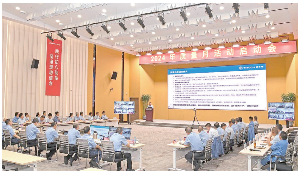
9月2日,太钢召开2024年“质量月”启动会议。