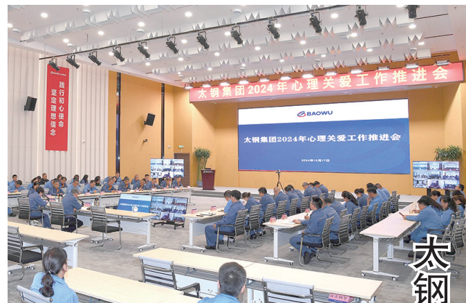
10月17日,太钢工会召开心理关爱工作推进交流会。