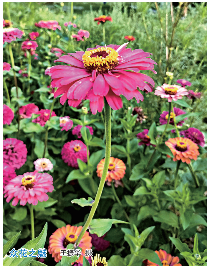
众花之魅

作风过硬点将台。严格的训练更要有严明的团队纪律,在进入预赛开赛环节,作为客场的代县矿业公司代表队又经历三天艰难的赛场考验。在去往岚县矿业公司的第一天,他们5点发车,路遇大雨高速临时封路,下午14点才允许放行到达场地,他们没顾上用餐就即刻投入到第一天的现场彩排中,为达到精准、整齐和动作衔接,他们将武术健身操钻研到底,刻苦训练到子夜1点,队伍回到宾馆入住已是3点,第二天6点又准时起床展开开幕式训练和入场仪式,这样高强度集训他们没有退缩,大家互相配合和关照,硬是扛下来了,而第三天他们还需要继续完成艰难的正式比赛。毽球、乒乓球、台球他们取得3个团体第一,象棋、羽毛球、健身操全部取得位列前三的好成绩,这些都是他们那伟大的矿山精神——钢铁报国、矿山当先、艰苦奋斗、开拓创新,在传承着,他们以无限的拼搏与勇气,文化与信念将这份精神带到了矿山的每一个角落,为矿山高质量可持续发展做出新贡献。